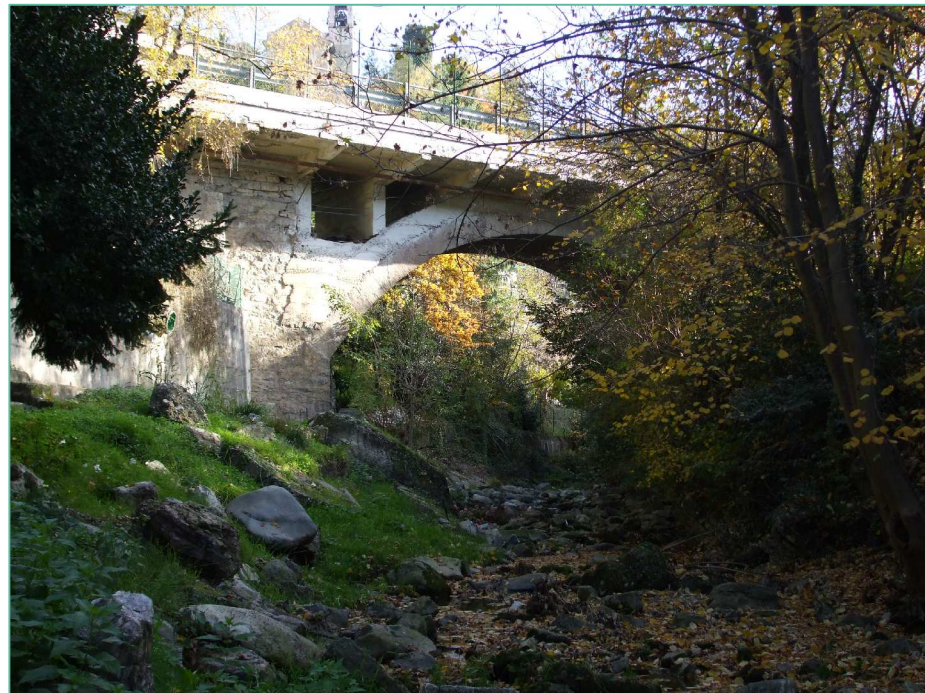
F1 - DOCUMENTAZIONE FOTOGRAFICA